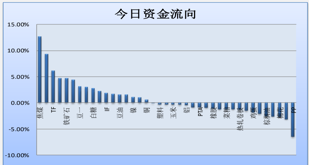
图一：当日资金流向概览

地址：北京市东城区东直门南大街3号国华投资大厦8层 国都期货有限公司 网址：www.guodu.cc